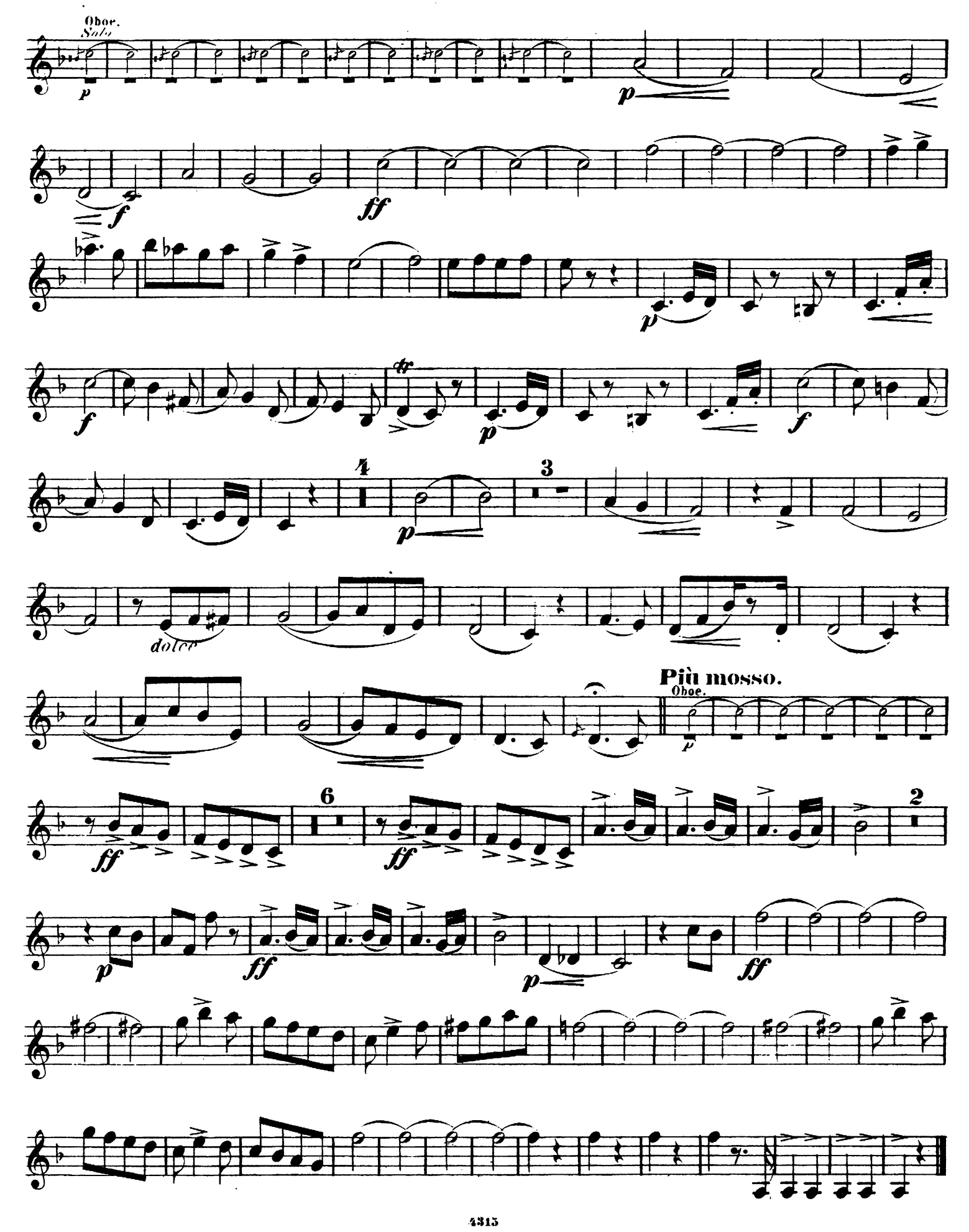
Clarinetto II in B.