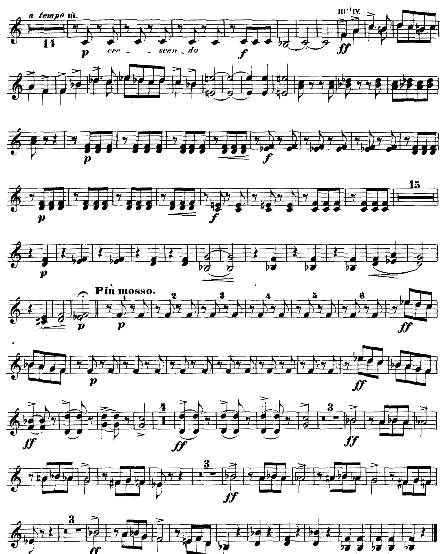
Corno III u. IV.